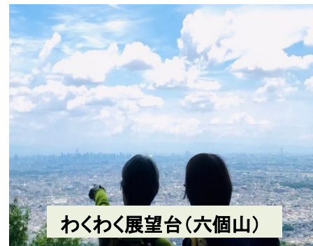
わくわく展望台(六個山)