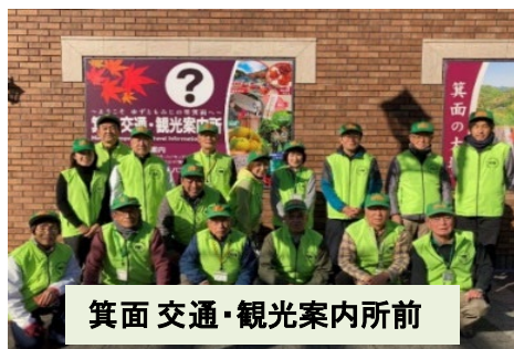
箕面 交通・観光案内所前