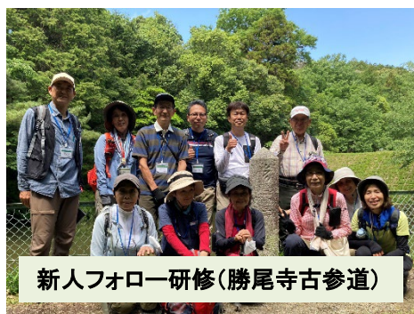
新人フォロー研修(勝尾寺古参道)