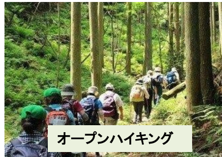
オープンハイキング