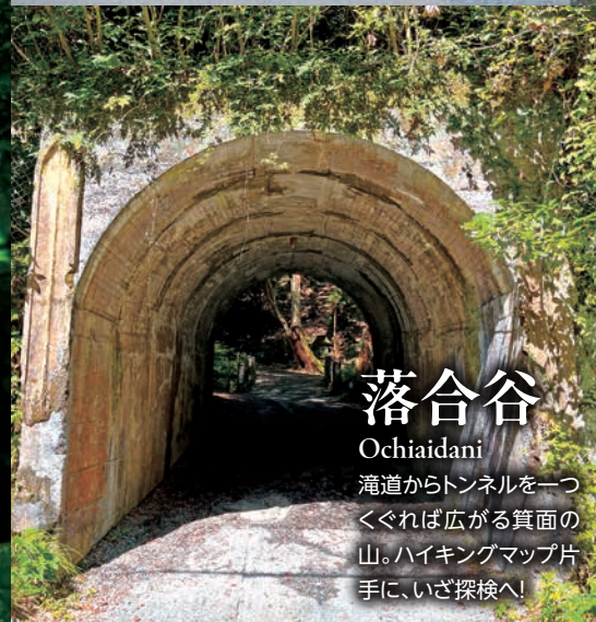
落合谷 Ochiaidani 滝道からトンネルを一つくぐれば広がる箕面の山。ハイキングマップ片手に、いざ探検へ!