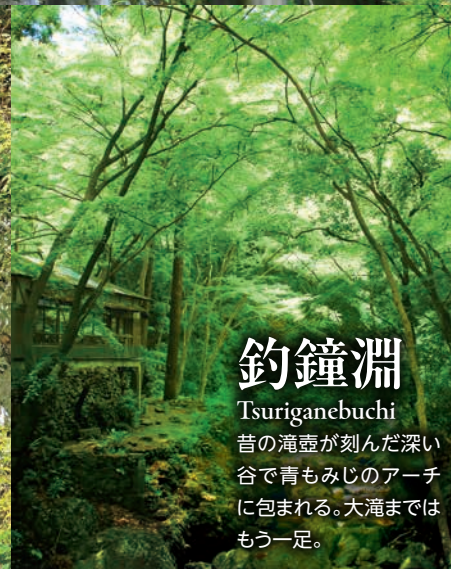
釣鐘淵 Tsuriganebuchi 昔の滝壺が刻んだ深い谷で青もみじのアーチに包まれる。大滝まではもう一足。