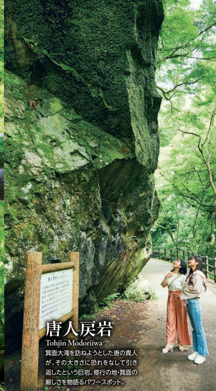
唐人戻岩 Tohjin Modoriwa 箕面大滝を訪ねようとした唐の貴人が、その大きさに恐れをなして引き返したという巨岩。修行の地・箕面の厳しさを物語るパワースポット。

聖天宮 西江寺 Saikouji Temple 箕面に入った役行者が本尊・大聖歡喜天と出会った地に建つ古刹。何かを始める前に、よき出会いを求めて訪れてみては。