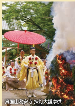
箕面山瀧安寺 採灯大護摩供