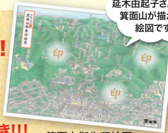
箕面山御朱印絵図